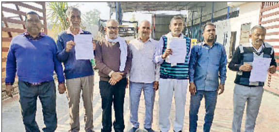
प्रॉपर्टी आईडी में दर्ज त्रुटियां दिखाते नगरवासी व नपा के खिलाफ रोष प्रकट करते हुए।

आवासीय मकानों का क्षेत्रफल बढ़ा-चढ़ाकर दर्ज किया