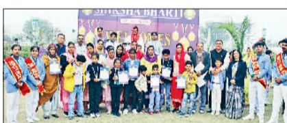
नरवाना। विजेता बच्चों को सम्मानित करते हुए।