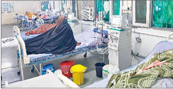
जहां डायलिसिस की बढ़ती मांग को देखते हुए, वर्तमान में 12 मशीनों के माध्यम से हर महीने लगभग 900 डायलिसिस सत्र तीन शिफ्टों में किए जा रहे हैं। हरियाणा सरकार की यह जनहितैषी योजना प्रदेश के लोगों को गंभीर बीमारियों के इलाज में बड़ी राहत प्रदान कर रही है। सिविल

मुख्यमंत्री नयब सिंह सैनी के नेतृत्व में हरियाणा सरकार द्वारा जन कल्याण के प्रति अपनी प्रतिबद्धता को दोहराते हुए, कैथल जिले के नागरिक अस्पताल में किडनी रोगियों के लिए निःशुल्क डायलिसिस सुविधा एक वरदान साबित हो रही है। अक्टूबर 2024 से शुरू की गई इस सुविधा का लाभ अब तक 1143 मरीजों ने उठाया है, जिन्होंने कुल 11,082 डायलिसिस सत्र निःशुल्क करवाए हैं। जिला नागरिक अस्पताल