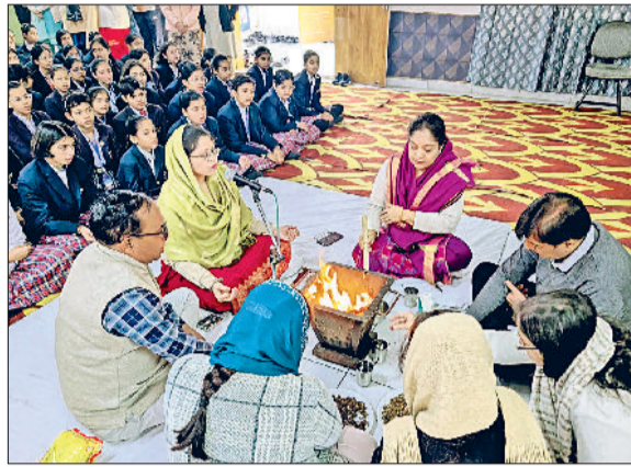
जीद। यज्ञ में अहूति डालते हुए इंडस स्कूल प्रबंधन तथा भजन सुनाते हुए बच्चे।