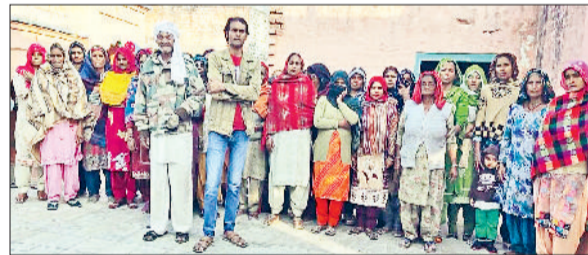
कलायत। मनरेगा योजना को लेकर एकत्रित मजदूर।