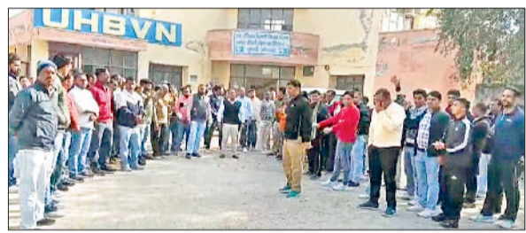
पूंढरी। ऑनलाइन स्थानांतरण नीति के विरोध में रोष जाहिर करते बिजली कर्मचारी।