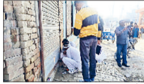
को सिंचाई विभाग के एसडीओ और ड्यूटी मजिस्ट्रेट दिपांशु पुलिसबल के साथ लेकर वार्ड 10 पहुंचे और दुकान को सील कर दिया।

मीट शॉप का विरोध करने पर मजबूर होना पड़ रहा था। शिकायत पर नपा ने सात मई को मीट शॉप को बंद कर सील कर दिया था लेकिन दुकान के मालिक ने दुकान को फिर से खोल लिया था। इसकी सूचना मिलते ही नपा ने मंगलवार को फिर से ड्यूटी मजिस्ट्रेट और पुलिस की मौजूदगी में दुकान को सील कर दिया। मंगलवार