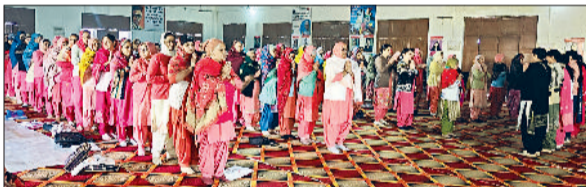
उचाना। प्रशिक्षण शिविर में हिस्सा लेते आंगनवाड़ी कार्यकर्ता।