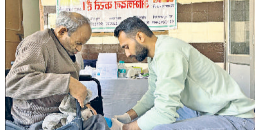
नरवाना। जांच करते हुए चिकित्सक।